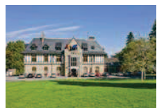
Le château du Ceran, à Spa.