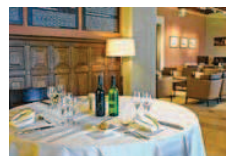
Les repas, toujours très soignés.