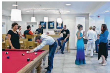
En immersion, on apprend aussi durant les moments de détente.